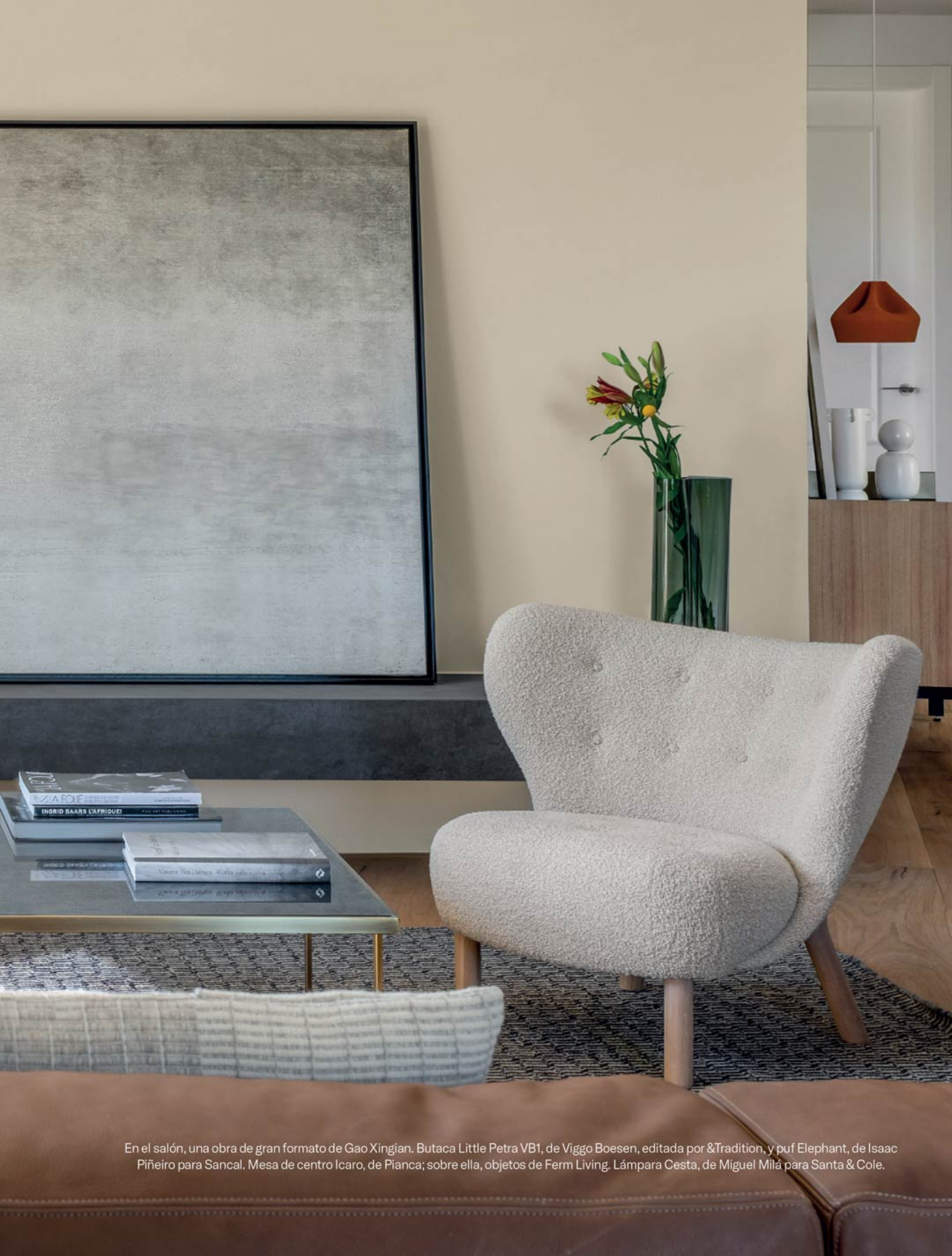
En el salón, una obra de gran formato de Gao Xingjian. Butaca Little Petra VB1, de Viggo Boesen, editada por &Tradition, y puf Elephant, de Isaac Piñeiro para Sancal. Mesa de centro Icaro, de Pianca; sobre ella, objetos de Ferm Living. Lámpara Cesta, de Miguel Milá para Santa & Cole.