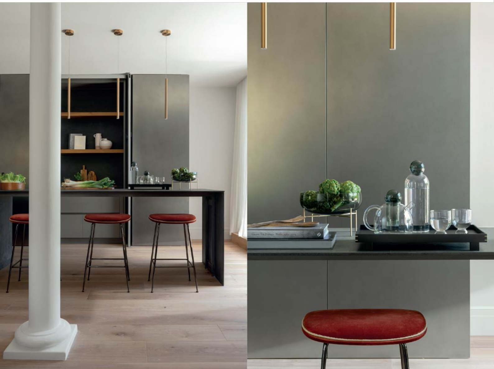
El mobiliario integral de la cocina es de Modulnova, con una gran isla revestida con material porcelánico pétreo. Taburetes Beetle Bar, diseño de GamFratesi para Gubi. Las lámparas de suspensión son las Mika, de Aromas del Campo.